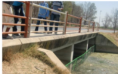
Fig7 : emplacement de grillage