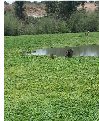
Fig2 : Natte dense couvrant le plan d'eau