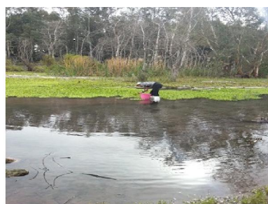
Fig8 : premiers lâchés de N.affinis