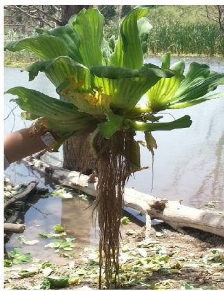
Fig1 : Plante de P.stratiotes

Fiche réalisée par Mme Drissi El Bouzaidi Rachida Chef de service de la protection des végétaux Fès