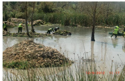
Fig6 : lutte manuelle au niveau du site