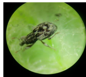
Fig3 : Adulte de N.affinis

Pour le contrôle biologique seul le curculionide Neohydronomus affinis est spécifique dans le contrôle de Pistia stratiotes .